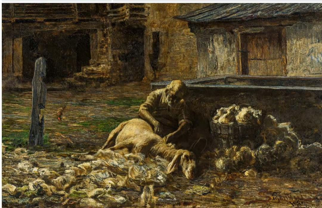
Pablo Picasso, Visage aux yeux rieurs, céramique, 1969. Barbara Hepworth, Pierced round form, bronze, 1959/60. Giovanni Segantini, Il reddito del pastore, huile sur toile, 1883/86.