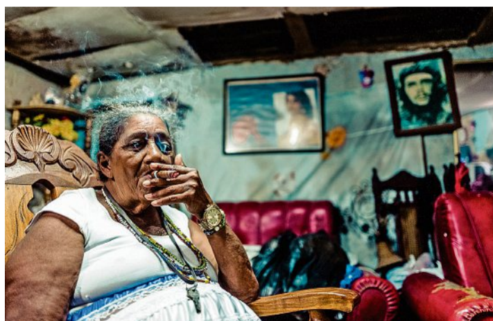
David Olifson, photographie. Femme fumant un cigare dans son salon, sous le regard du Che Guevara. DAVID OLIFSON

En 2018, il nous invitait à prendre le «Départ pour Delhi», une exposition où les contrastes de l'Inde se déployaient dans toute leur splendeur. Désormais, il nous amène à Cuba. À La Havane, plus précisément. Un voyage immersif et coloré entre-